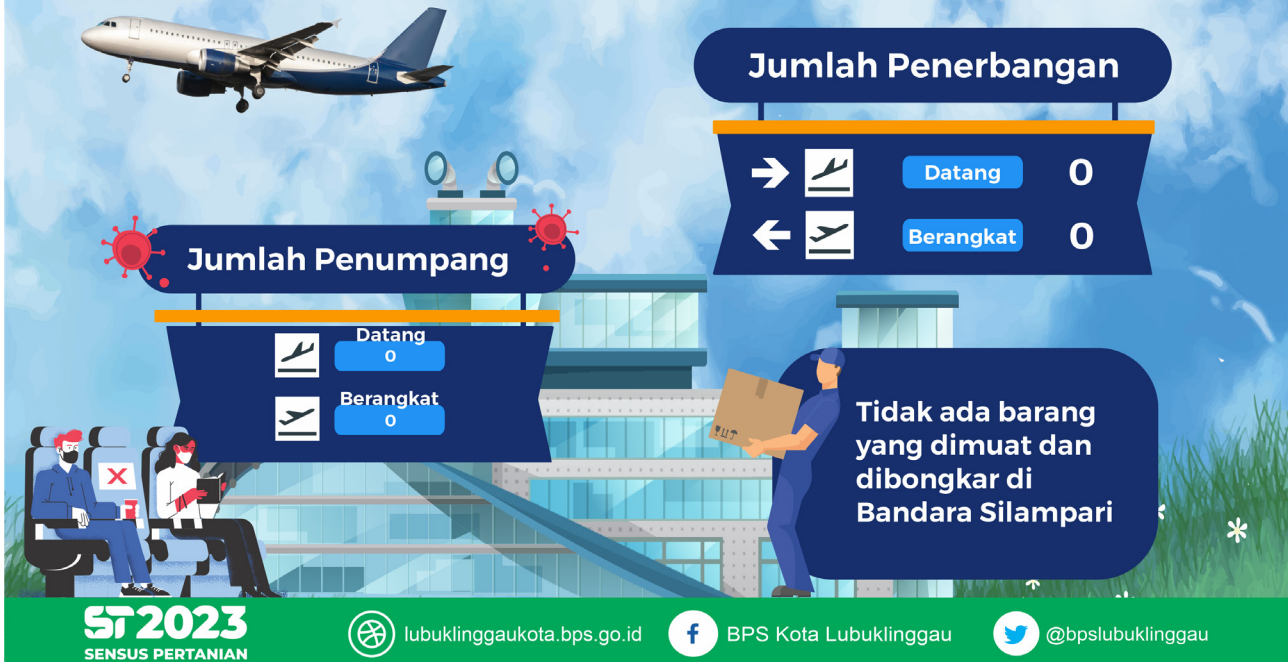
Gambar 3 Infografis Perkembangan Statistik Transportasi Udara Kota Lubuklinggau, Januari 2022