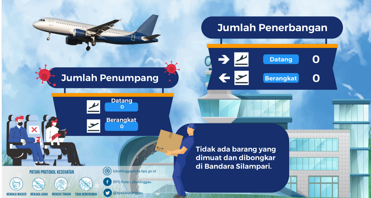
Gambar 3 Infografis Perkembangan Statistik Transportasi Udara Kota Lubuklinggau, November 2021