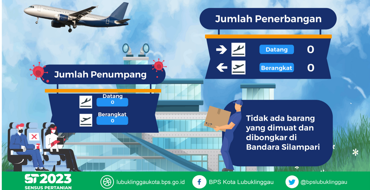
Gambar 3 Infografis Perkembangan Statistik Transportasi Udara Kota Lubuklinggau, Februari 2022